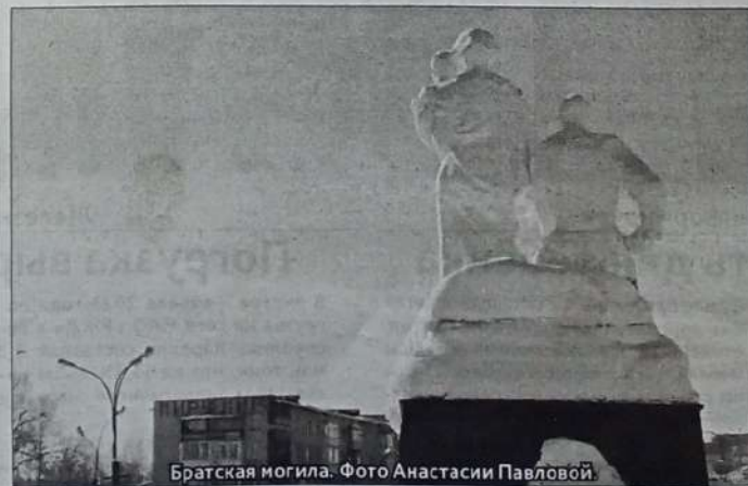
Братская могила.

о боевых подвигах защитников Сортавала в 1941 году. Сам памятник представляет обелиск в виде штыка, у его основания прикреплён корабельный якорь. На боковых и лицевой сторонах находятся мемориальные плиты. Этот памятник напоминает мне «Дорогу жизни» по льду Ладожского озера. Ладога, суровая Ладога, скольких людей ты спасла во время блокады Ленинграда. Эти страшные страницы открываются через книги и фильмы «Блокада», «Ленинград», документальный фильм «Освобождение». А в нашей школьной библиотеке на видном месте стоят книги «Забвению не подлежит» и «Письма из Блокады». Книга «Забвению не подлежит» издана к 75-летию полного освобождения Ленинграда от фашистской блокады. «Письма из блокады» – сборник воспоминаний ленинградцев о блокаде.